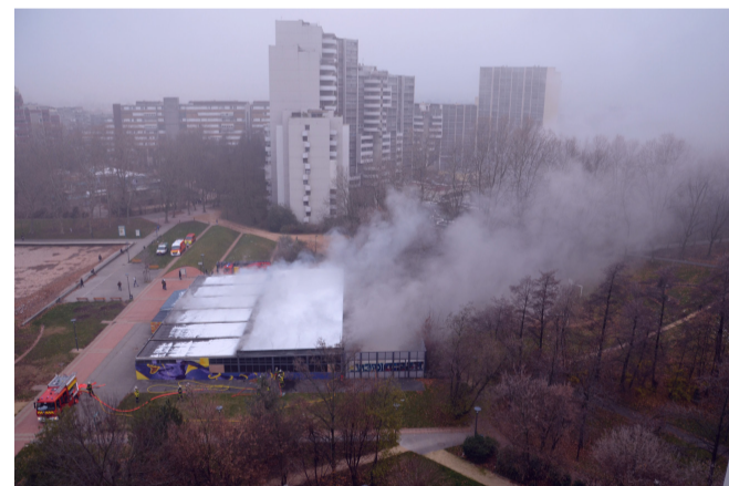
Non, ce n'est pas le hammam qui fuit mais l'incendie de la piscine Iris, mercredi 6 décembre 2017.

Ce projet de hammam s'inscrit dans le cadre de Gren' de projets ( www.grendeprojets.fr ), une opération de la ville de Grenoble qui cherche à refoirguer ses bâtiments désaffectés. Outre la piscine Iris, dont la mairie ne sait toujours pas quoi faire depuis qu'elle l'a fermée en juin