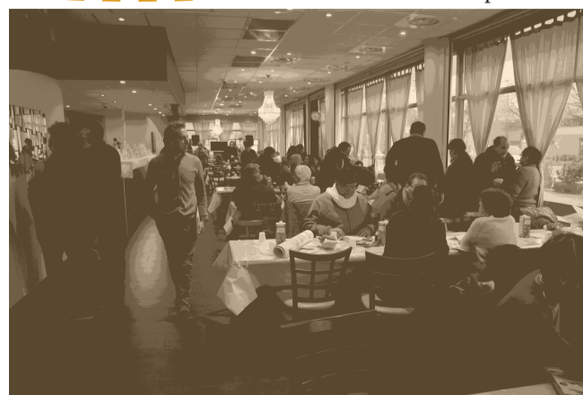
Au restaurant L'Arceau, avenue Marie Reynoard, samedi 28 novembre, habitants de la Villeneuve et du Village Olympique ont rencontré les élus grenoblois pour échanger leurs idées sur les grandes lignes de la rénovation urbaine.

(l'intégralité de l'article sur www.lecrieur.net )