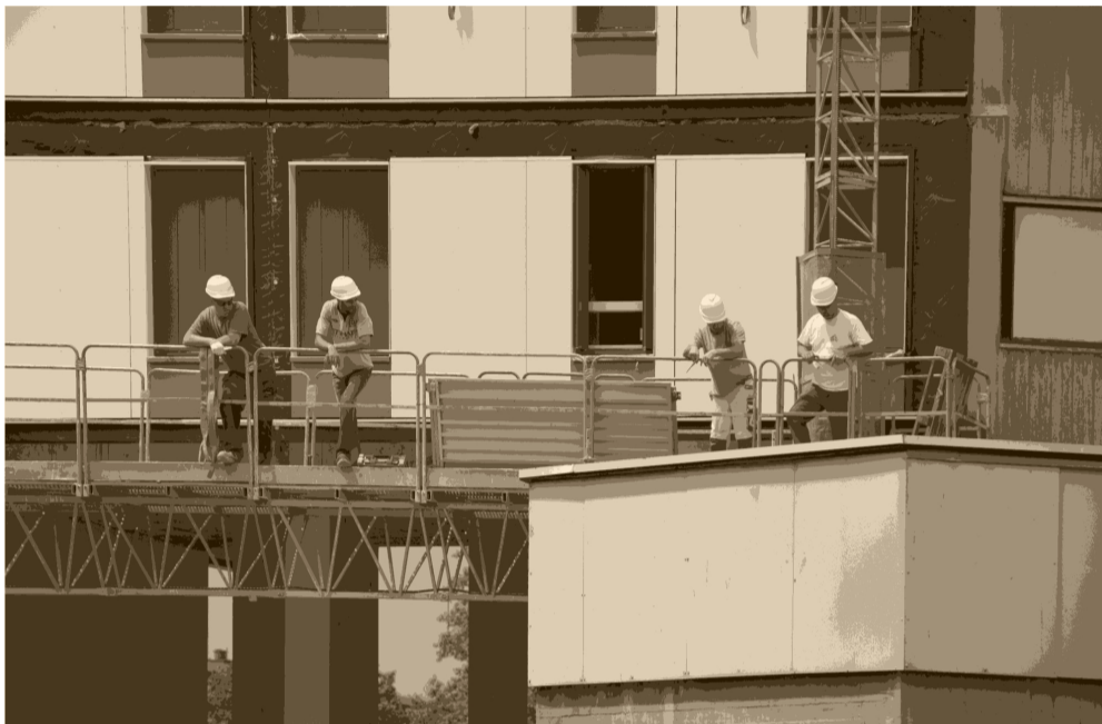
Ouvriers pendant la rénovation du 40 galerie de l'Arlequin, juin 2015.

Environnement : la Villeneuve de Grenoble et celle d'Échirolles ont été sélectionnées par l'État pour un programme de rénovation énergétique des bâtiments. 71 millions d'euros seront consacrés aux 20 quartiers retenus, a annoncé le 25 janvier Patrick Kanner, ministre de la Ville.